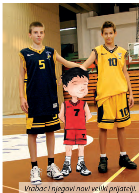
Vrabac i njegovi novi veliki prijatelji.

Košarkaški početnici iz pravih dugonja s velikim tenisicama, rukama i nogama poput tankih grančica, vremenom se razvijaju u visoke snažne momke.