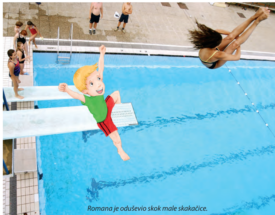
Romana je oduševio skok male skakačice.

Da biste mogli vježbati skokove u vodu, morate imati elastičnu dasku ili učvršćeno zaletište na tornju i, naravno, bazen pun vode. Elastične daske postavljaju se na visini od jednog i tri metra iznad površine vode. Dužina tih dasaka je četiri metra, a širina pola metra.