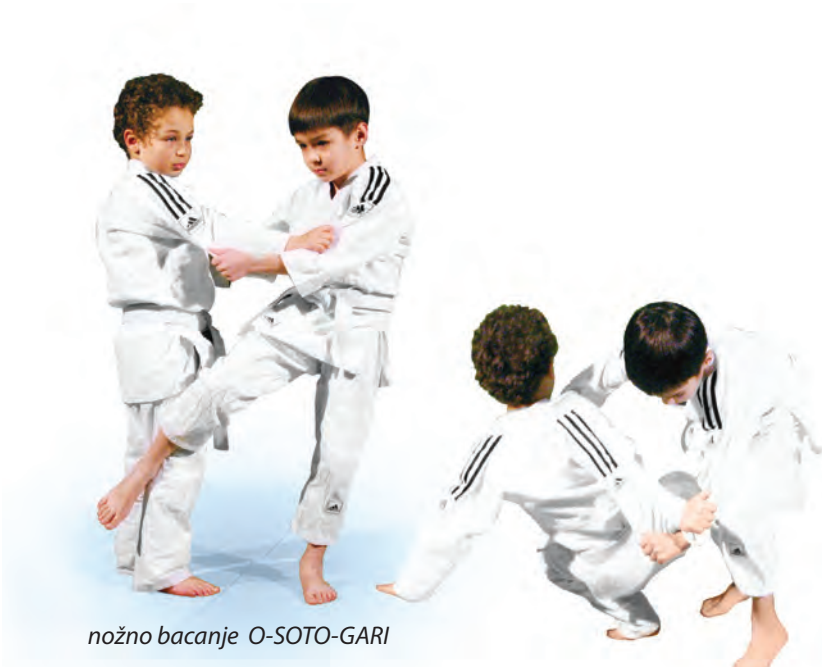
nožno bacanje O-SOTO-GARI

Džudaši nose kimono i pojas oko struka. Kimona su bijela ili plava, a pojasevi su žuti, narančasti, plavi, smeđi i, naravno, crni – majstorski. Boja pojasa ovisi o znanju džudaša i godinama treniranja. Nakon barem 10 godina redovitog treniranja može se polagati za crni pojas.